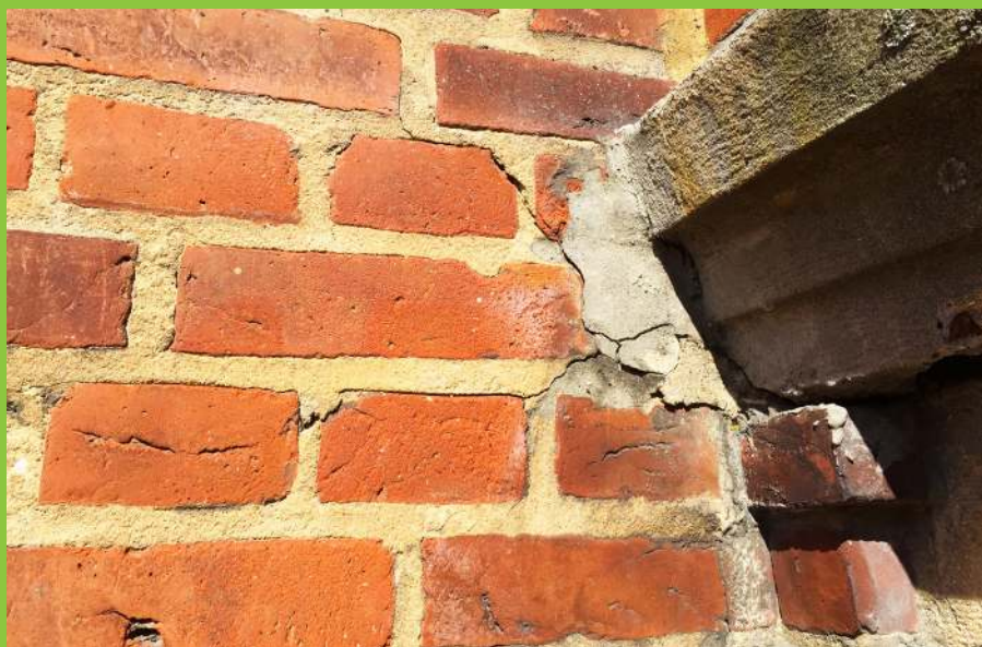
Figur 6: Revner i mørtelfuger omkring område med udliggerjern giver øget adgang for fugt til udliggerjern, hvilket kan være medvirkende til at initiere korrosion på stålprofilet.

En visuel besigtigelse bør ikke stå alene, såfremt nogen af de beskrevne skadestegn er tilstede.