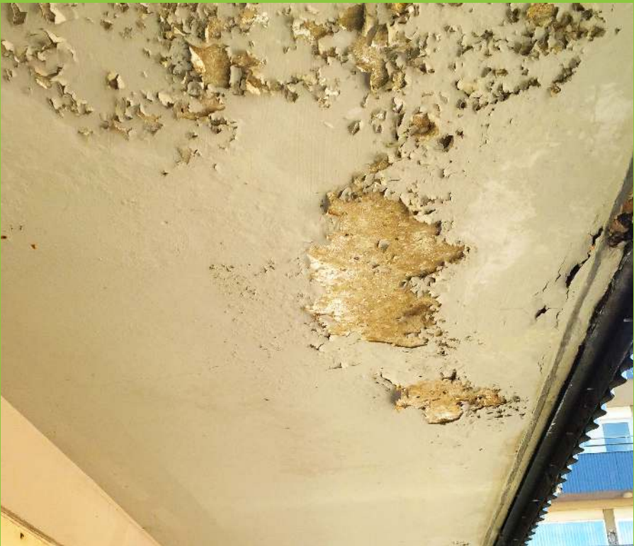
Figur 4: Afskalninger af maling og hvide udfældninger på underside af altan, hvilket indikerer, at der foregår en utilsigtet fugtpåvirkning af betonen.

kan det være indikationer på, at nedbrydning af de indstøbte udliggerjern er i gang (figur 4).