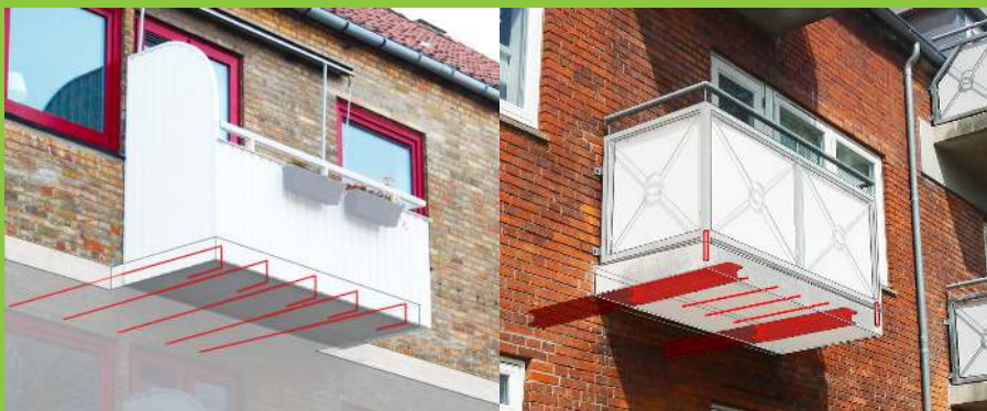
Figur 1: Den primære bærende funktion i en udkraget altanplade kan både være udgjort af indstøbte armeringsjern, som er med ud i altanpladen fra etagedækket (tv.) eller af omstøbte stålprofiler (udliggerjern), der er fastgjort til bjælkelaget (th.).

Betonaltaner med indstøbte udliggerjern ses typisk på bygninger fra perioden 1900-1960.