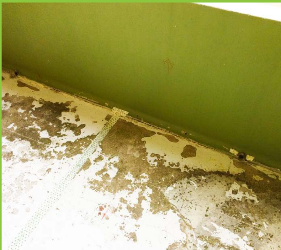
Figur 11: Udslidt/defekt belægning på overside af altan medfører øget opfugtning af betonen.

Belægninger på en altans overflader kan, udover at forhindre fugtindtrængning, også have den funktion, at de begrænser betonens reaktion med luftens CO 2 (karbonatisering), hvilket i sidste ende vil være medvirkende til at forlænge betonens levetid. En tæt membran vil derfor være medvirkende til at forlænge betonens levetid.