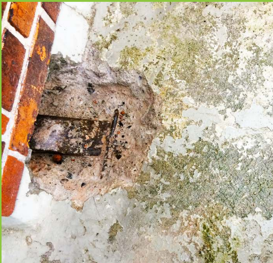
Figur 8: Ophugning til udliggerjern foretaget ind under facade til besigtigelse af jernets tilstand i området under facademuren.

Derfor kan det være en god ide at få din altan undersøgt af en fagperson, som kan vurdere, om en ophugning er påkrævet, selv om der ikke umiddelbart er synlige tegn på nedbrydning.