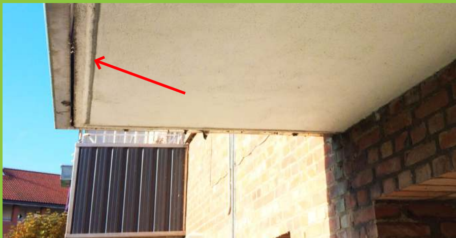
Figur 10: Drypnæse (markeret på foto) ved forkant som i dette tilfælde er "indstøbt" i betonen. Drypnæsen sørger for, at overfladevand drypper af ved altanens forkant og reducerer opfugtningen af altanens underside.