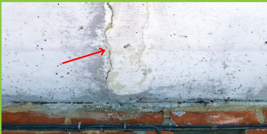
Figur 3: Altan med udliggerjern, hvor der ses revner og opbuling i undersiden, som er orienteret vinkelret på facaden. I dette tilfælde er revnen opstået som følge af korrosion på et overliggende udliggerjern. Denne type revner og udbulinger kan både optræde i altanens over- og underside afhængig af, hvor på udliggerjernet korrosionen foregår. Bemærk, at der ikke ses rødbrune udfældninger i forbindelse med revnen, selv om der foregår korrosion.

Korrosionsprodukter fra jern fylder op til 10 gange mere end jernets oprindelige størrelse. Når jern, der er indstøbt i beton, rustet, vil denne volumenforøgelse derfor medføre revner og afskalninger af betonen over jernet (figur 3). Ligeledes vil rustdannelser ofte, dog ikke altid, kunne medføre rødbrune udfældninger på betonoverfladen.