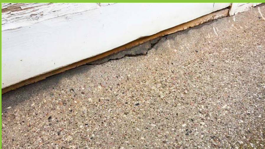
Figur 5: Øverst: Defekt fugte under udgangsdør til altan. Øget adgang for fugt til området under døren, hvorfor eventuelle udliggerjern, som er placeret i dette område, vil være ekstra udsatte for korrosion. Nederst: Altan, hvor tætning mod facade og under dørparti er udført med hulkehl. Der ses her revne i hulkehlen under dørparti, hvorfor dennes funktion lokalt vil være forringet.