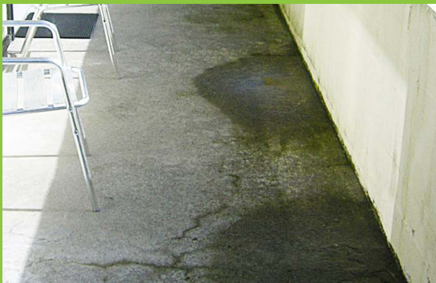
Figur 9: Altan hvor afvanding ikke foregår korrekt. I dette tilfælde opstår vandpytter mod brystning ved altanens forkant.