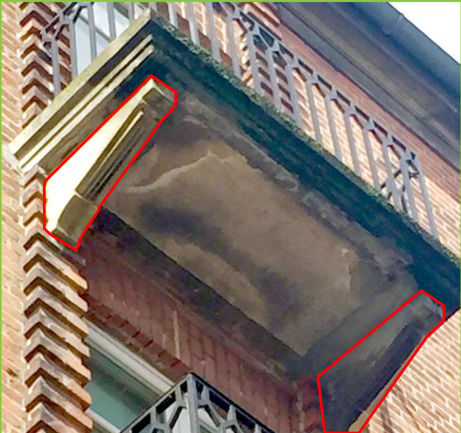
Figur 2: Altan med udliggerjern, som er udført med "pyntekonsoller" (markeret på foto), der kan give anledning til at tro, at det statiske system er anderledes end det i virkeligheden er.

Kortlægningen af en altans konstruktive udformning samt selve tilstandsvurderingen af altanen bør altid udføres af en fagperson med speciale i tilstandsvurderinger af altaner.