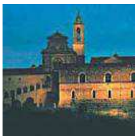
Middelalderlig brug af altaner - og inspiration for den moderne altan (Klosterborgen i Galuzzo, Norditalien).

Op gennem århundrederne udvikledes der en række balkon- og altanlignende påbygninger på borgerhuse og boliger for "almindelige" mennesker, som peger frem mod vore dages begejstring for altanen.