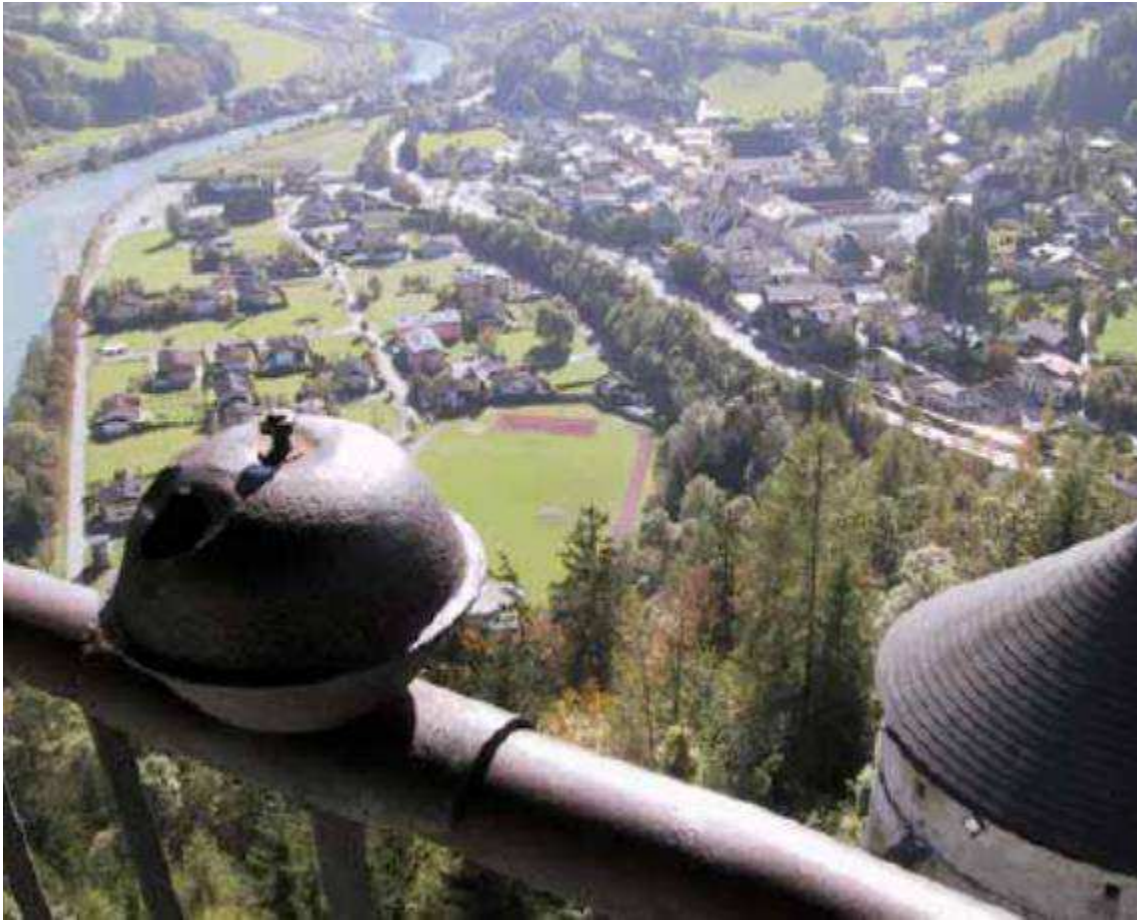
Fra en skyttealtan på middelalderborgen Hohenwerfen i Salzburgerland, Østrig - med fantastisk overblik og udsigt