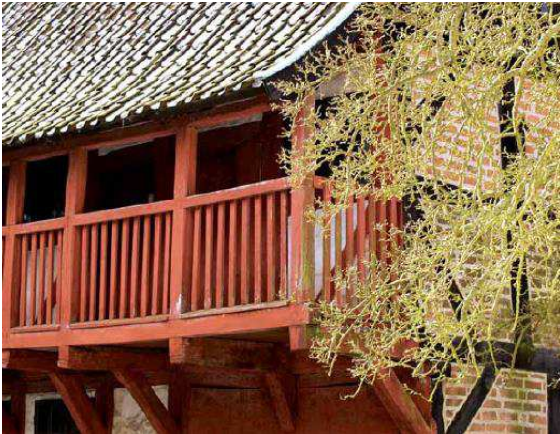
Svalegangen har sin moderne slægtning i altangangen (Den gamle by, Århus).

Det kan man bl.a. se på et antal huse i Den Gamle By i Århus og i de bevarede gamle købstadsmiljøer rundt om i Danmark. Med væksten i de europæiske storbyer opstod behovet og muligheden for at lave altaner på de store etageejendomme. Foran de store opholdsrum ses gerne en altan, der i dagligdagen nok mere var et arkitektonisk end et anvendeligt element. Opholdsaltanen er et nyere fænomen, som vi skal se nedenfor.